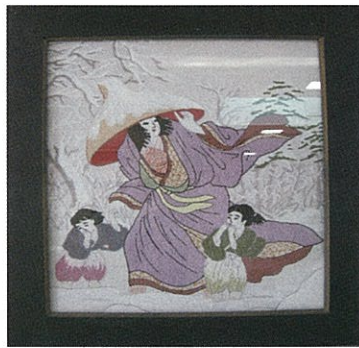
「常盤御前」 当園職員作